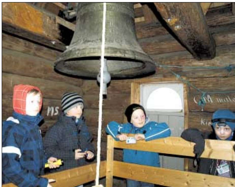
Godt kledde tårnagenter inspiserer en av klokkene i Fåberg kirke.

Det ble hengt opp to typer ballonger på et kors. Noen hang rett ned, og på dem kunne man skrive om vonde ting. Men noen var fylt med helium og sto rett opp. Der skrev man om gode ting. Gudstjeneste for og med barn Dagen etter var det gudstjeneste, og da ble ballongene med de vonde tingene sprukket og de "gode ballongene" sluppet løs. Symbolikken er at vi sprer det gode og knuser det vonde. Under gudstjenesten ble det vist lysbilder fra arrangementet, barna leste kommentarer og sang Tårnagent-sangen