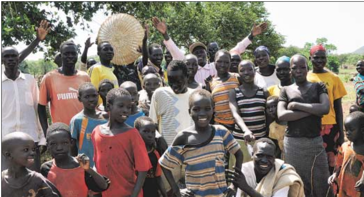
Landsbyen som tar imot oss.

litt småprat. De minste barna sov på moras rygg eller lå ved brystet.