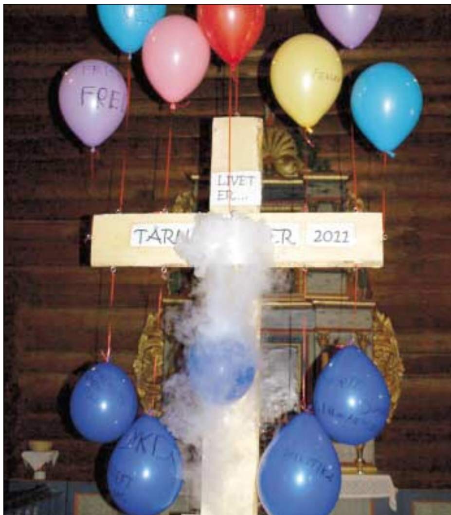
På de hengende ballongene kunne man skrive om vonde ting. Men noen var fylt med helium og sto rett opp. Der skrev man om gode ting.