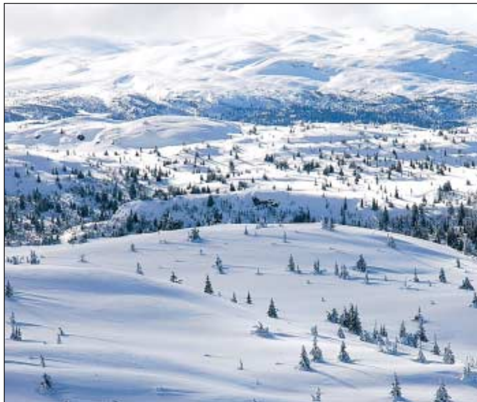
Utsikt fra «Prestkjerringa».

Jeg har lyst til å dele en gudstjeneste med dere, som rommer de samme elementene, men som bruker et annet språk. Noe av det som oppleves sterkest for meg er syndserkjennelsen, hvor jeg får bekjenne og legge fra meg fordi jeg får beskrevet Guds storhet. Møt disse ordene som en andakt, og se om bildene gir rom for dine Gudsbilder. (Jeg har med hensikt utelatt nattverden, som den viktigste delen av gudstjenesten. Dette fordi jeg mener nattverden er en fysisk handling og er ikke egnet som andaktslesning).