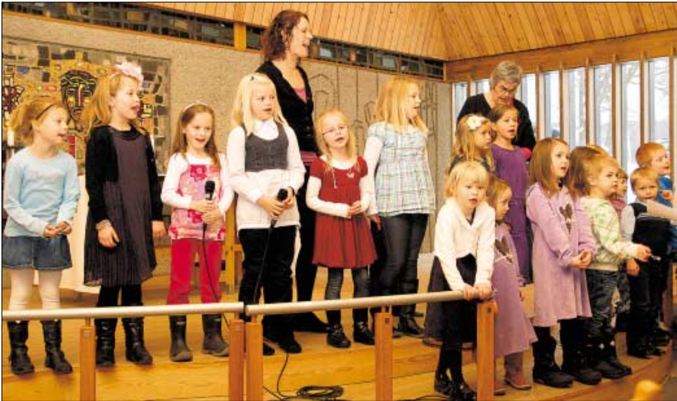
Pepper opptre på familiemesse i november 2010.

Etter en kordag i høst, med fullt band og mange dyktige musikalske mennesker kom det mange nye barn til Søre Ål minitensing. Nå består koret av ca 30 barn i alderen 5 til 12 år.