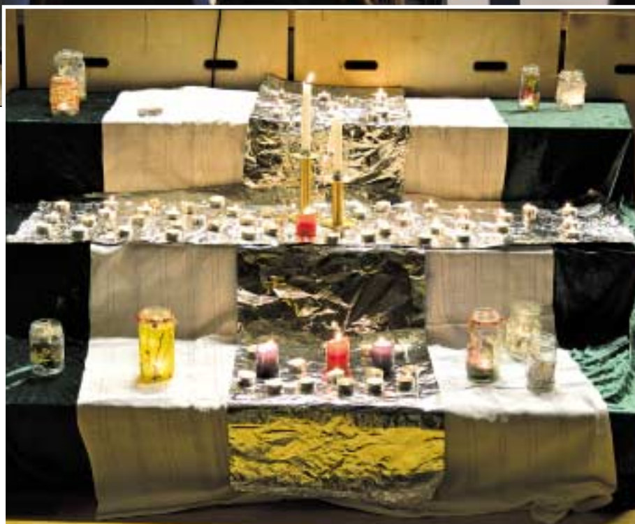
Lystening er en viktig del av konfirmantundervisningen.

Gudstjenesten ble løftet av flotte musikere som satte sitt preg på salmene som ble brukt, Ole Lauvli