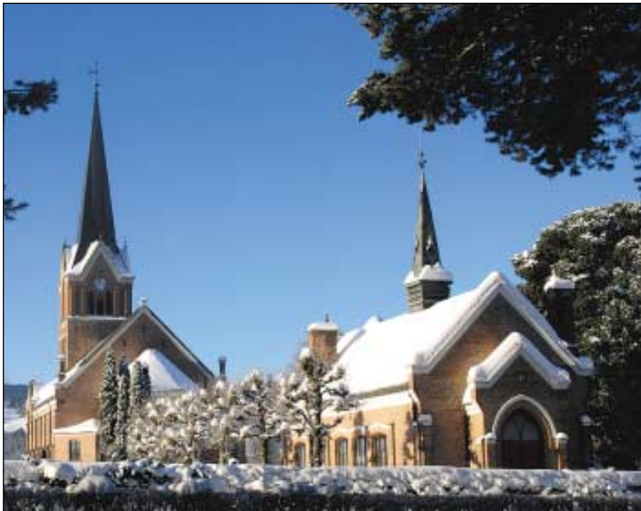
Kapellet er åpent fra kl 12 – 20 hver dag. Velkommen til en overraskende opplevelse, til ettertanke og meditasjon!

Vi gleder oss til å få ta del i og vise fram denne perlen i byen som kapellet er, plassert like ved Parken og Parkkafeen som er et av sentrene for