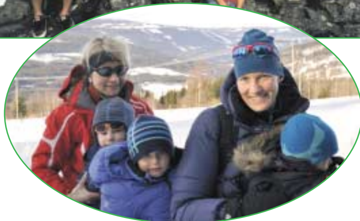
Fra kanefart i Saksumdal.