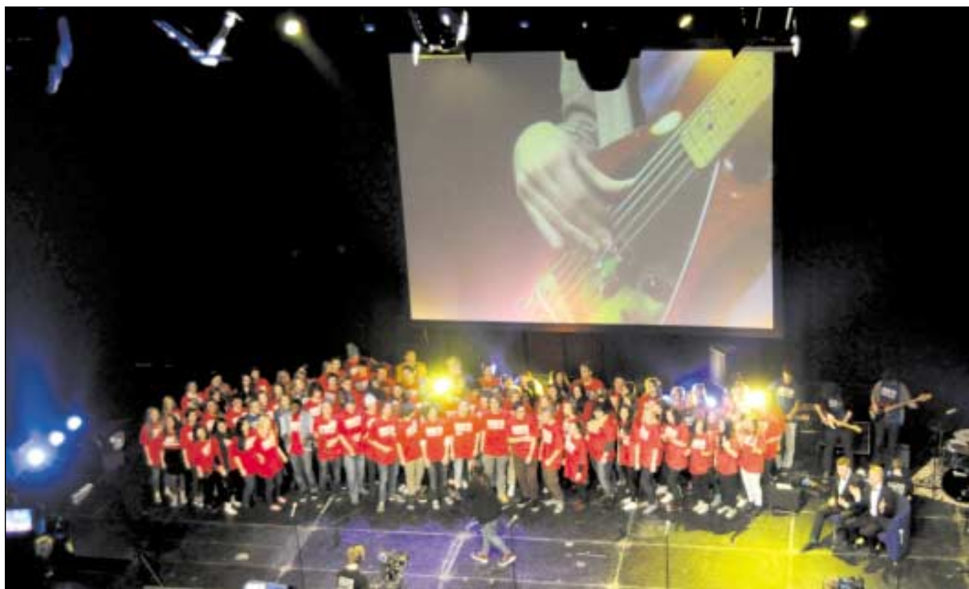
Ungdomslederne hadde et eget kor som sang gospel under åpningsshowet.

1000 konfirmanter, ledere og foreldre inntok Håkons Hall under historiens første «Hekta»-konfirmannt-weekend 10.-12. februar. Konfirmanter fra ca. 60 menigheter i Hamar bispedømme hadde dette som en del av sin konfirmannt-undervisning.