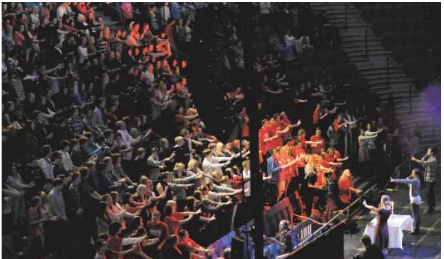
Konfirmanntene lærte mange nye sanger under weekend'en i Håkons Hall.

har tilbud om teen camp i Kragerø og oppfølgingshelger på Jorekstad og i Hafjell. De kan også gå på lederkurs og bli ungdomsledere.