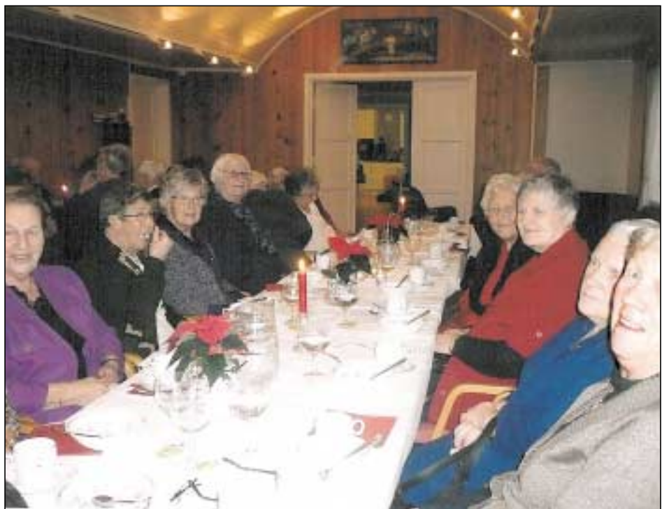
Mange møtte opp til 40-årsfeiringen.