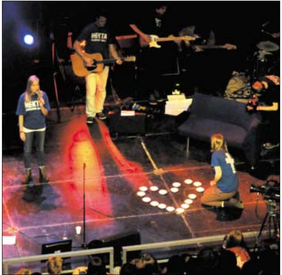
Stille kveldsavslutning med tid for bønn og ettertanke.

Hvordan finner man overnattingsplass til 1000 mennesker? De fleste under 20 år bodde i Håkons Hall, og noen av lederne og ansatte i menighetene bodde på Birkebeineren Hotel.